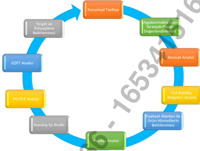
Şekil-1: Durum Analizi

Stratejik planlama sürecinin ilk adımı olan durum analizi, okulumuzun “neredeyiz?” sorusuna cevap vermektedir. Okulumuzun geleceğe yönelik amaç, hedef ve stratejiler geliştirebilmesi için öncelikle mevcut durumda hangi kaynaklara sahip olduğu ya da hangi yönlerinin eksik olduğu ayrıca, okulumuzun kontrolü dışındaki olumlu ya da olumsuz gelişmelerin neler olduğu değerlendirilmiştir. Dolayısıyla bu analiz, okulumuzun kendisini ve çevresini daha iyi tanınmasına yardımcı olacak ve stratejik planın sonraki aşamalarından daha sağlıklı sonuçlar elde edilmesini sağlayacaktır.